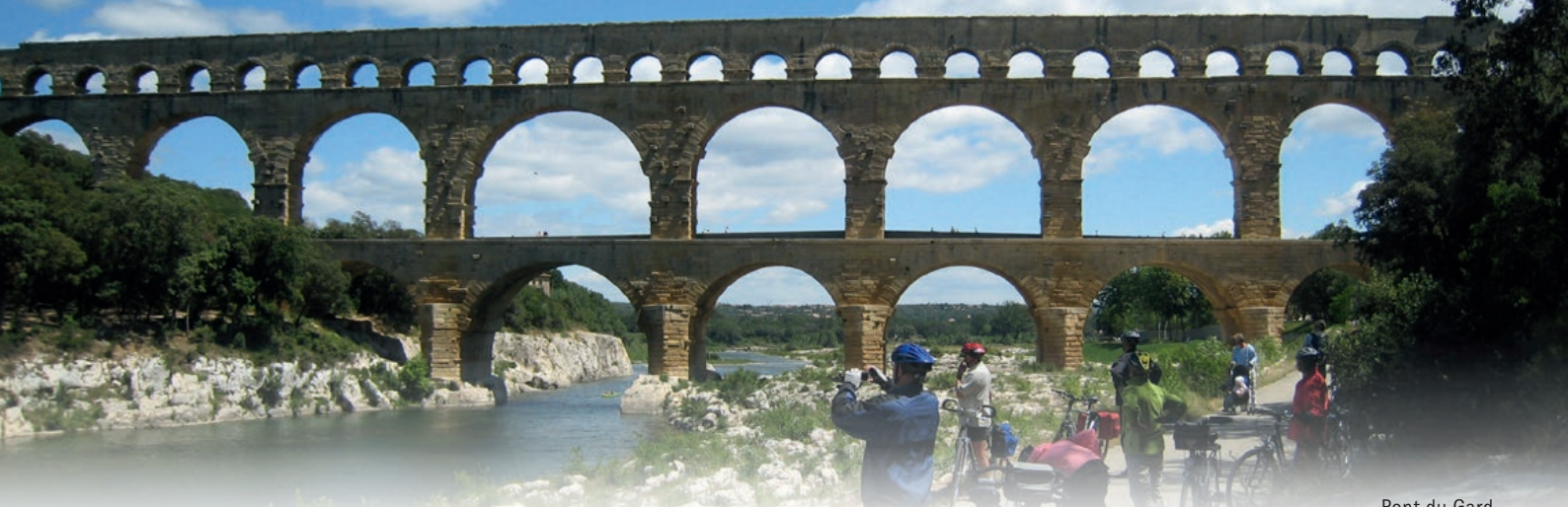
Pont du Gard