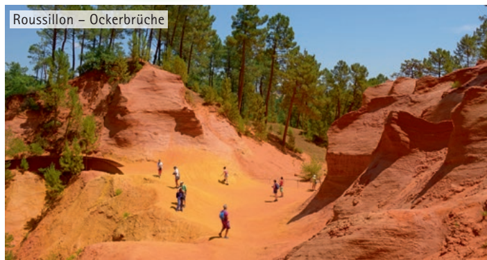
Roussillon – Ockerbrüche